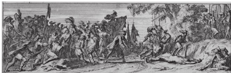
▲ Franse wredeheden in 1672 in Bodegraven en Zwammerdam: waterboarding. AFBEELDING VAN ROMEYN DE HOOGHE

De twee dorpen langs de Oude Rijn hebben aanvankelijk weinig te vrezen. Daar zorgt de Oude Hollandse Waterlinie voor, het gebied tussen Muiden en de Biesbosch dat de Staten van Holland onder water hebben laten zetten. Te on-