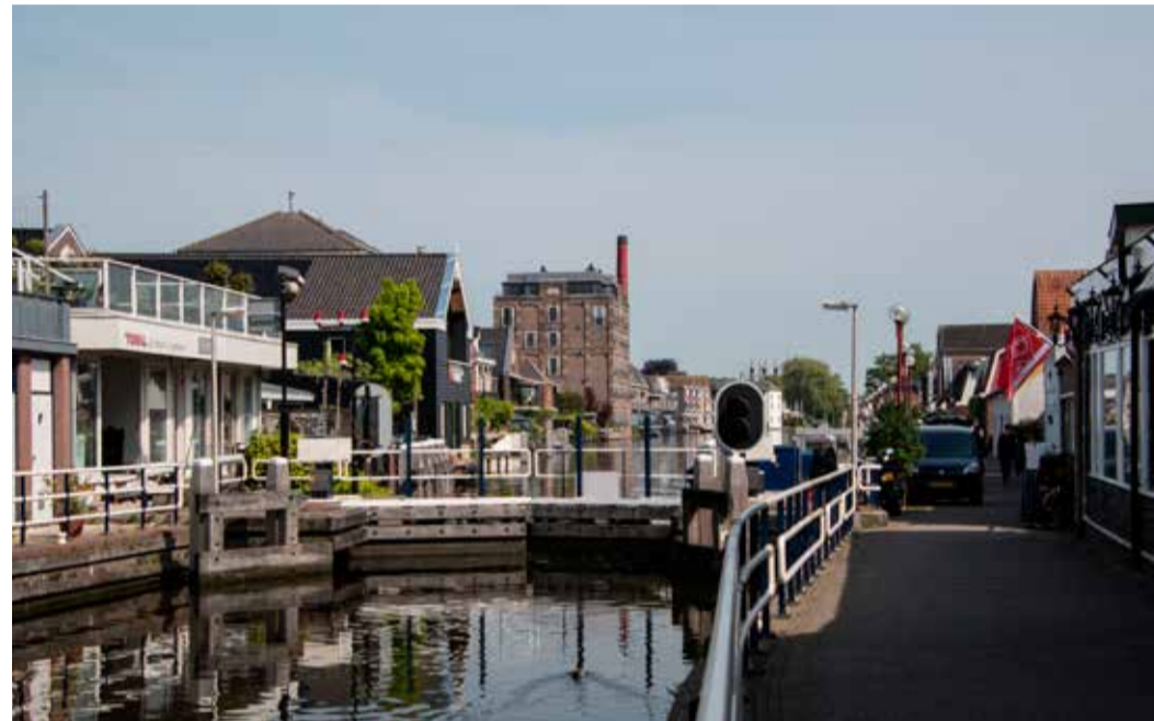
De sluis in Bodegraven speelde een belangrijke rol bij de inundatie