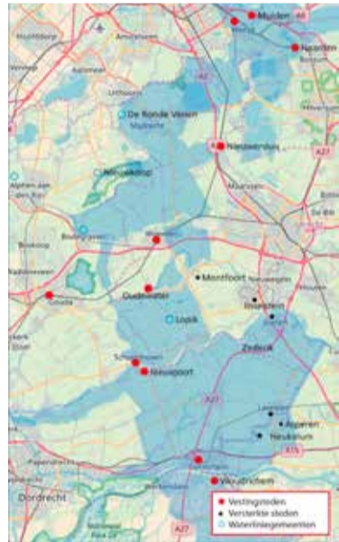
De Oude Hollandse Waterlinie in 2020