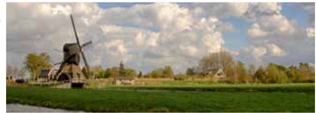
Ook molens waren een militair target in het Rampjaar; de Westveense Molen

De Michiel de Ruyter Vaarroute loopt van Woerdense Verlaat via de Vinkeveense Plassen naar Abcoude en vandaar via Uithoorn weer terug naar Woerdense Verlaat. De route voert langs tal van kleine riviertjes zoals Kromme Mijdrecht, Angstel en Waver met schilderachtige dorpjes, kastelen en diverse forten uit de Nieuwe Hollandse Waterlinie.