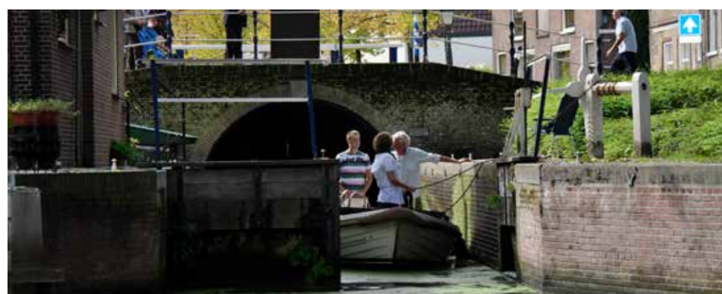
De Linschotersluis - gelegen binnen de vesting Oudewater - was een belangrijke inundatiesluis in het Rampjaar

Start: sloepensteiger Van Kempensingel (bij Landgoed Bredius), Woerden