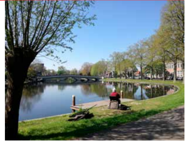
De singels van vestingstad Woerden

De vaarroute - in het spoor van Luxembourg - start in Woerden en loopt via de Grecht, Woerdense Verlaat en de Meije naar Zwammerdam, waarna weer de Oude Rijn wordt gevolgd. Op de route liggen onder meer Fort Wierickerschans en de verdwenen schansen van Nieuwerbrug.