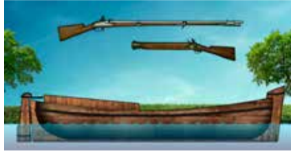
Model van een 17 e eeuwse uitlegger

Ook de Fransen zetten het water als wapen in en zo ontstond een soort guerrilla op het water. De Vechtstreek had in militair opzicht een bijzonder grote betekenis doordat de Waterlinie daar dwars doorheen liep. Uiteindelijk kwamen de Fransen op hun weg naar Amsterdam niet verder dan Breukelen, dat net ten oosten van de Waterlinie lag. Het dorp werd daardoor één grote legerplaats. Door deze oorlog had de Vechtstreek zwaar te lijden: vrijwel alle dorpen werden geplunderd en in brand gestoken, kastelen en kloosters verwoest. Bijna alle buitenplaatsen langs de Vecht zijn na 1672 herbouwd.