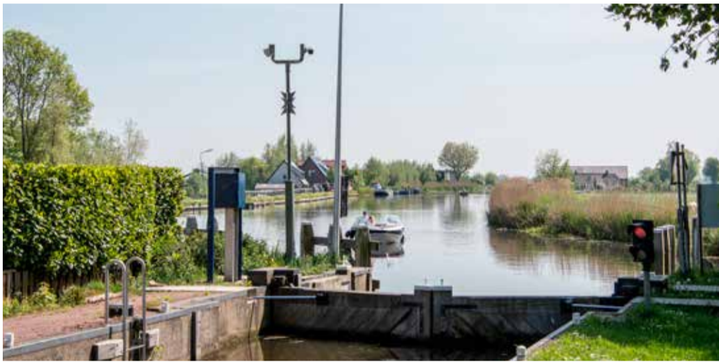
Vanuit Woerdense Verlaat werden in het Rampjaar de polders onder water gezet; daarom werd hier veel strijd geleverd