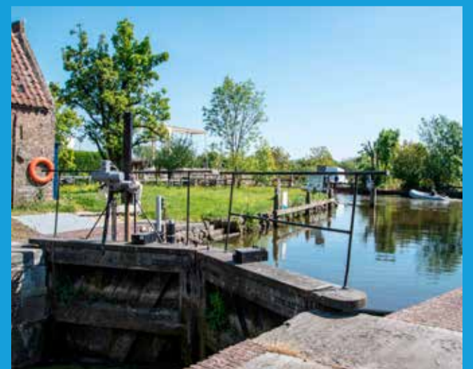
De Goejanverwellesluis was van grote strategische betekenis en werd daarom verdedigd door de Goejanverwelleschans

Het Hollands-Utrechtse veenweidegebied leek in 1672 grotendeels veranderd in een soort binnenmeer. Vanuit hun versterkte posities bestookten de Hollandse en Franse troepen elkaar, waarbij de Republiek uitleggers inzette. Dit zijn kleine zwaarbewapende binnenvaartscheepjes. Ook de Fransen zetten het water als wapen in en zo ontstond een soort guerrilla op het water. De vaarroutes van de Oude Hollandse Waterlinie lopen dwars door dit oude frontgebied van het Rampjaar!